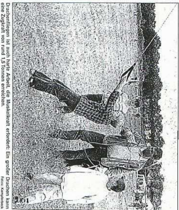
Drachentafel ist auch harte Arbeit, die Muskelkraft erfordert: Ein großer Drachen kann eine Zugkraft von rund 1,5 Tonnen erreichen.

„Manche Drachen können auch bei Regen fliegen“, erklärte Nijhuis. „Das liegt ganz am Material“. Schwirrkellen kann es nur nachher zuhause geben. Die Frau ist meistens nicht gerade begeistert, wenn die Drachen im Wohnzimmer, im Flur und der Küche zum Trocknen ausgebreitet sind“, meinte Nijhuis schmunzelnd.